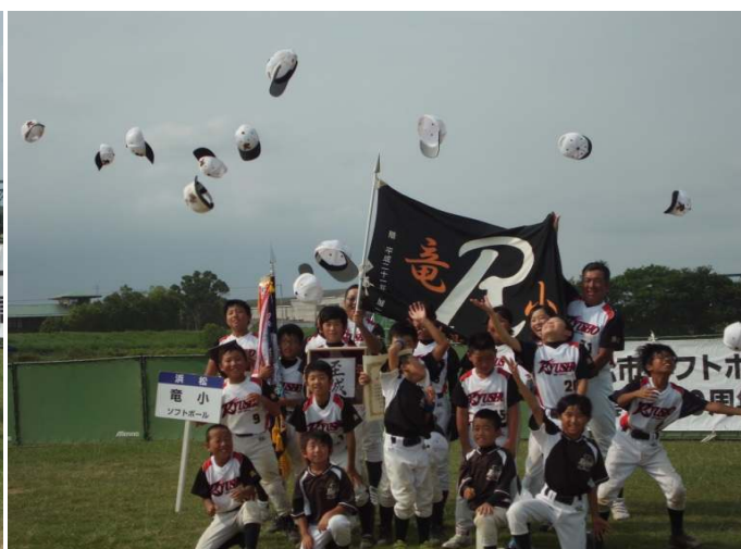
準優勝 竜小ソフトボール