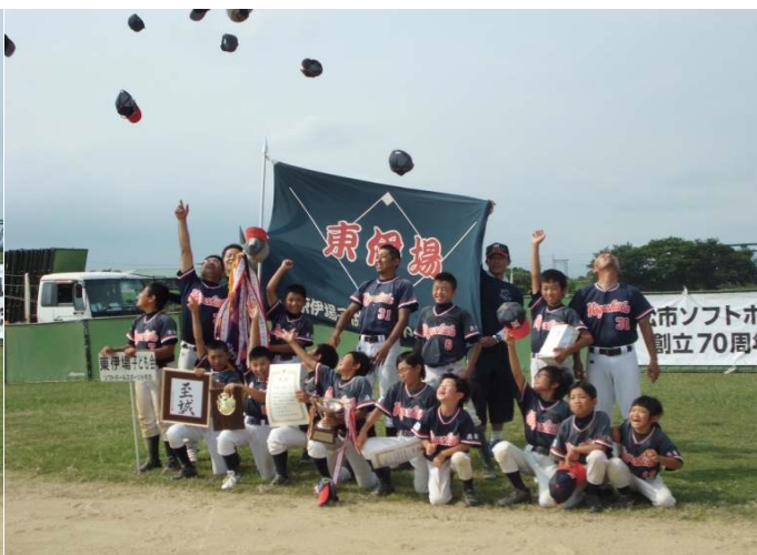
優勝 東伊場・ドルフィンズBOYS